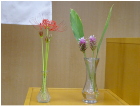
クルクマ (栗原良幸会長) 彼岸花 (建部卓也幹事)