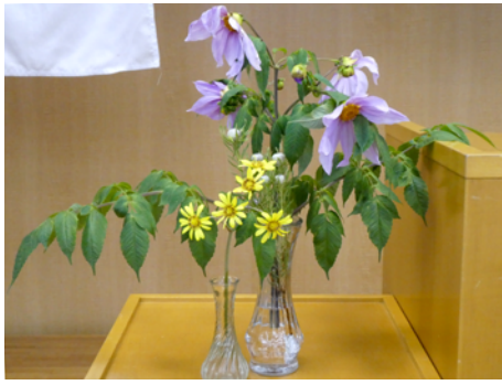
リューカデンドロ (栗原良幸会長) ツワブキ (建部卓也君) 皇帝ダリア (滝澤 勇君)