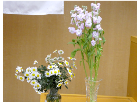
フリージア (栗原良幸会長) ノースポール (建部卓也君)