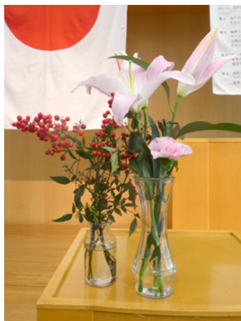
ユリ (前島憲司会長) 南天 (建部卓也君) カーネーション (山本晃久君)