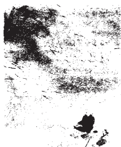
霞たつながき春日をこどもらと手まりつきつこの日暮らしつ

児童養護施設は、児童福祉法第41条に定められた児童福祉施設の一つです。予期できない災害や、事故、親の離婚や病気、また不適切な養育を受けているなど様々な事情により家庭での養育が困難な子どもが生活しています。そうした子どもたちが幸せで健やかな発達を支援するのが児童養護施設役割です。