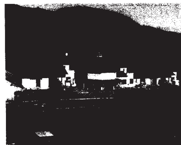
ふれあいの村から見た児童棟とホール棟